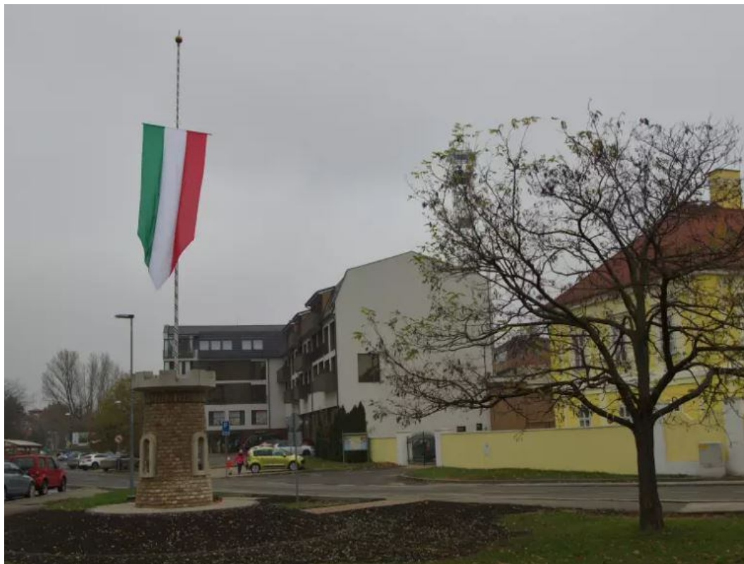
Obr.: Maďarská vlajka v Dunajskej Strede na Múzejnej ulici blízko centra mesta

Symbolika stavby odkazuje na maďarské hnutie tzv. relikvijnej štátnej vlajky (Ereklyes Országzászló), založené maďarským poslancom, politikom (tretím predsedom Uhorskej ligy na ochranu územnej integrity) Nándorom Urmánczom, ktorého ideou je revízia Trianonu a obnovenie Uhorska, čoho symbolom je vztyčovanie maďarskej štátnej vlajky na pol žrde. Toto hnutie patrí k najvýraznejším prejavom revizionizmu a iredenty a vzniklo po rozhodnutí maďarského parlamentu z 13. novembra 1920, že maďarská štátna vlajka na budove parlamentu zostane na pol žrde dovtedy, kým nebude obnovené staré Uhorsko.