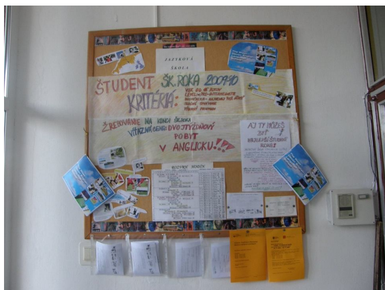
Obr.: Nástenka v jazykovej škole – ročník 2009/2010

Jazyková škola bola pôvodne zaradená MŠ SR do siete škôl od septembra 1998 a bola pričlenená ku slovenskému Gymnáziu v Dunajskej Strede. Od 1.1.1999 bola samostatným právnym subjektom. V prvom školskom roku 1998/99 bolo na škole zriadených 9 kurzov s anglickým, nemeckým a francúzskym jazykom s počtom poslucháčov 293. Najviac poslucháčov doteraz navštevovalo školu v školskom roku 2003/2004 – 521 poslucháčov s počtom kurzov 31. V tom istom školskom roku sa škola odčlenila od gymnázia a presťahovala sa do sídla školy: Športová ul. 349/34, 92901 Dunajská Streda. Na škole sa vyučujú jazyky: anglický, nemecký, francúzsky, taliansky, španielsky, ruský, slovenský, maďarský, podľa záujmu prihlásených poslucháčov. Najväčší záujem je o anglický a nemecký jazyk. V poslednom roku svojej pôvodnej existencie mala okolo 400 žiakov.